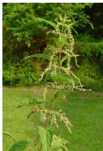
Urticaceae (korovi) Poaceae (trave)