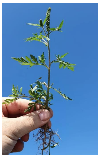
Ambrozija (korovi) Poaceae (trave)