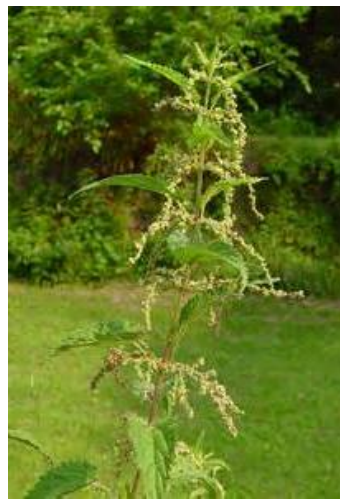
Urticaceae (korovi) Poaceae (trave)