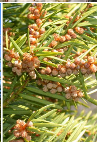
Pregled alergeni biljaka u KS tokom mjeseca aprila (breza, borovi, tisa i čempresi).