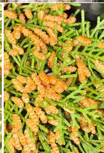
Pregled alergeni biljaka u KS tokom mjeseca aprila (breza, borovi, tisa i čempresi).