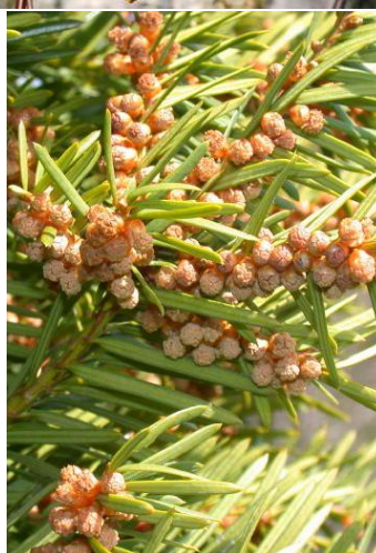
Pregled alergeni biljaka u KS tokom mjeseca aprila (breza, borovi, tisa i čempresi).