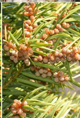
Pregled alergeni biljaka u KS tokom mjeseca aprila (breza, borovi, tisa i čempresi).